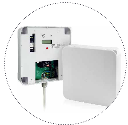
Q gateway 5 batteriebetrieben oder mit Stromversorgung erhältlich